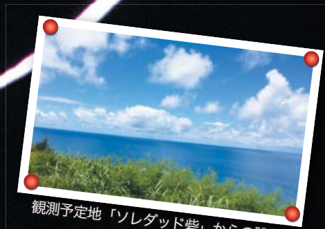
観測予定地「ソレダッド砦」からの眺望